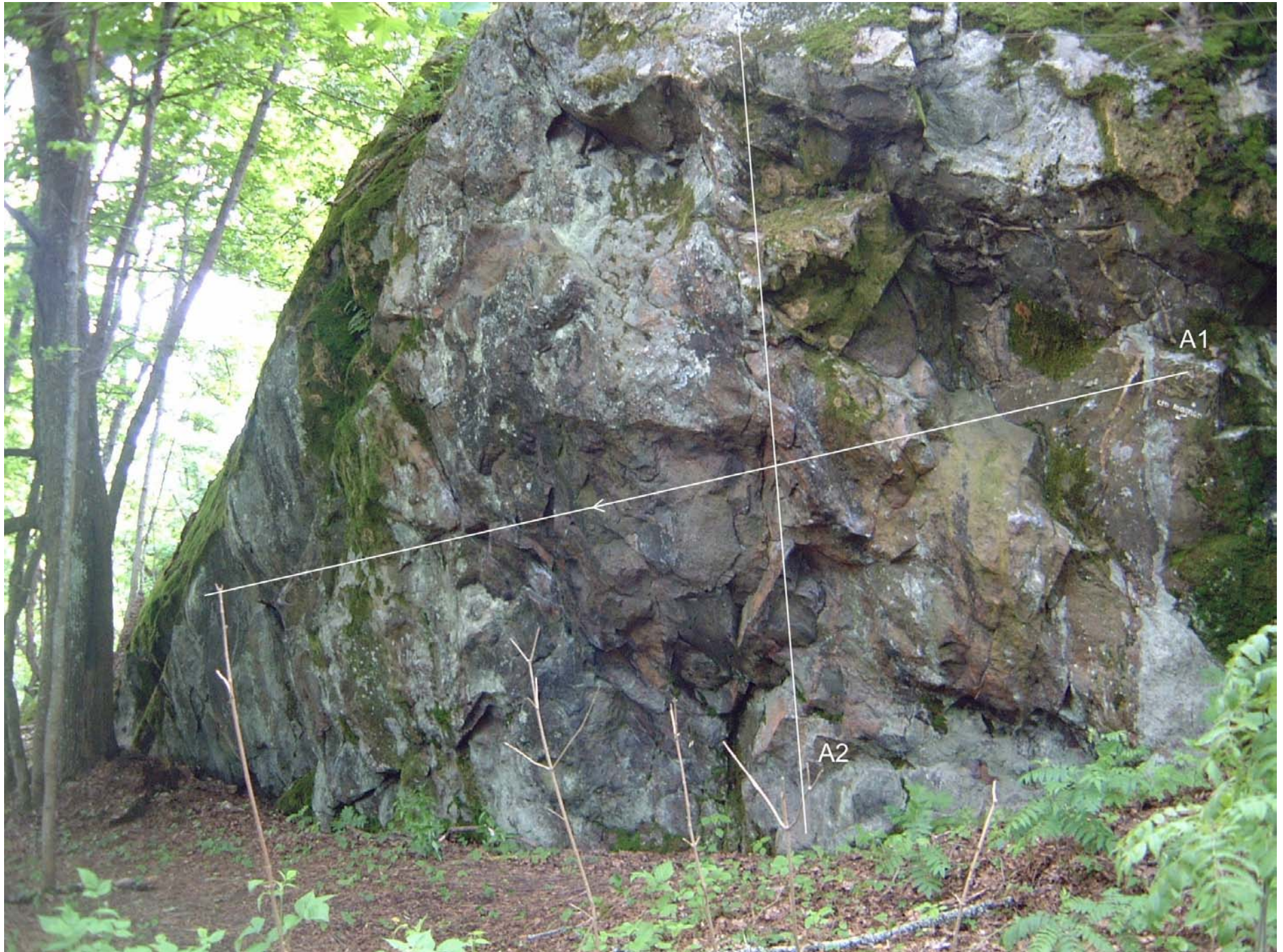
A1. Cro Magnon (6b+) A2. Magnum 44 (5+)